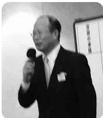
陣支配人退任挨拶