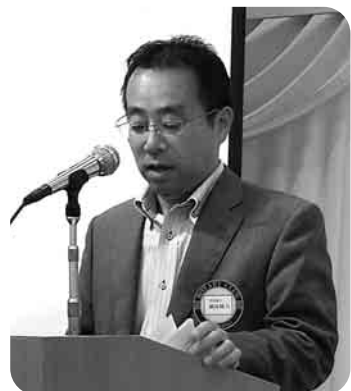
卓話 瀬高雑誌広報委員長