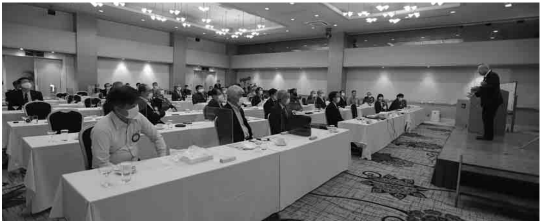
ガバナーアドレ熱演