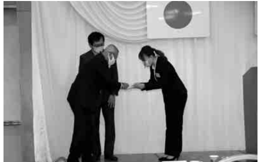
ガバナーもロ・シンさんを激励