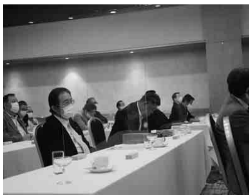
熱心に聞きいる皆さん