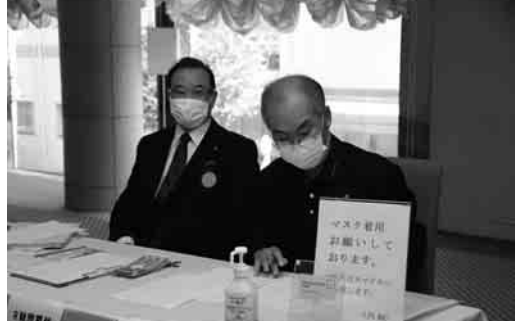
ロータリー財団委員長と副委員長 御寄付依頼