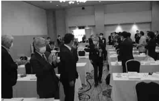
ガバナーご夫妻ご入場